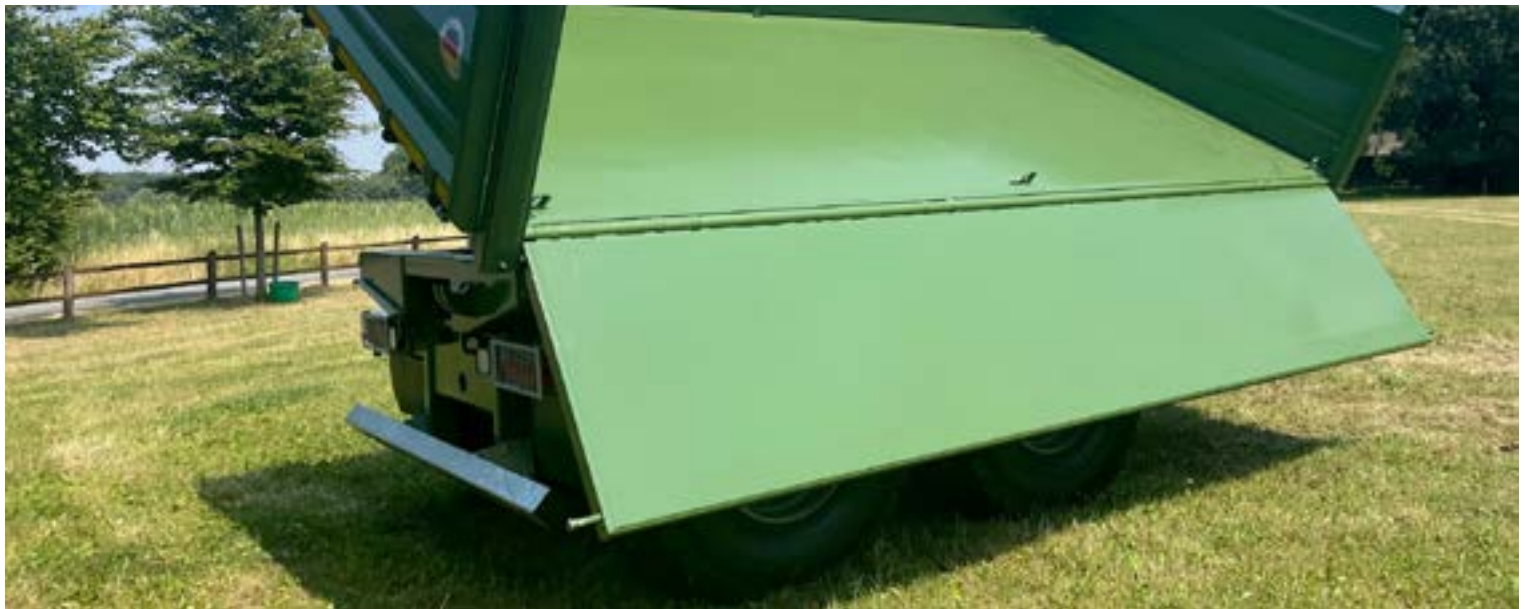
BORDMATIK für eine Seitenwand beim Schwerlast-Dreiseitenkipper (in Fahrrichtung links oder rechts, durch drei doppeltwirkende Hydraulikzylinder mit einer 1.000 mm Stahlbordwand aus verschleißfestem Stahl Hardox 450)