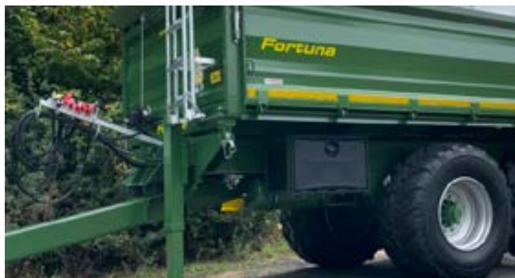
Werkzeugkasten in Fahrtrichtung links & schwingungsgedämpfte Zugdeichsel