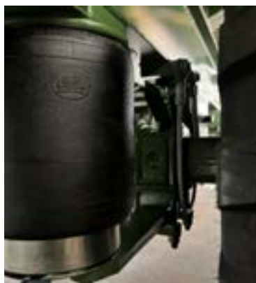
24 t Luftfederung, Fabrikat BPW inkl. einem Ventil für Heben und Senken und einer Schnellentlüftung