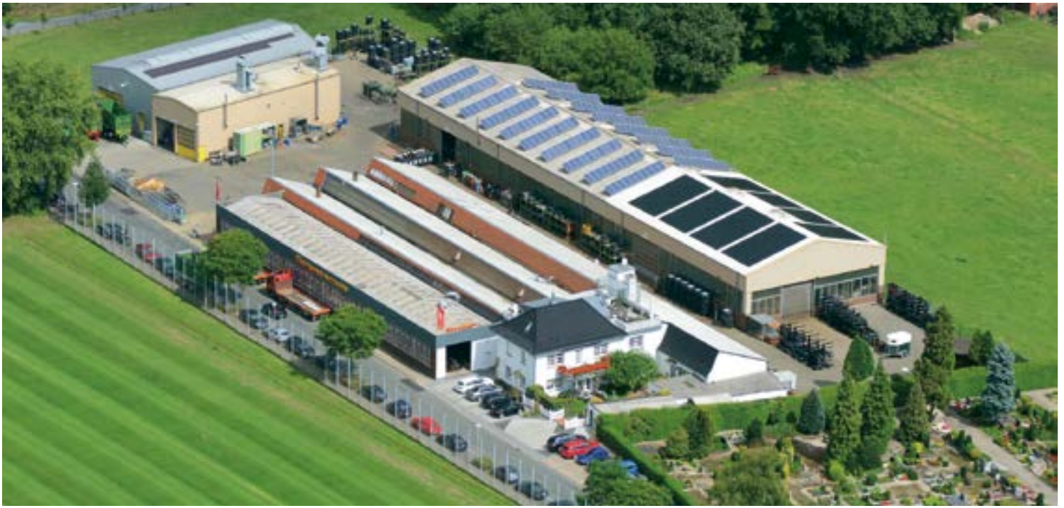
Produktionsstandort I 'Alte Maate' – 48607 Ochtrup (Deutschland)