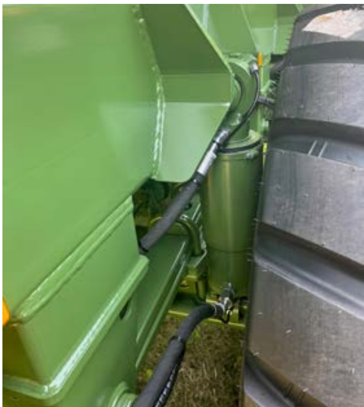
Hydropneumatische Federung (hydraulische Federung), Fabrikat: BPW, Achsabstand: ca. 1.550 mm