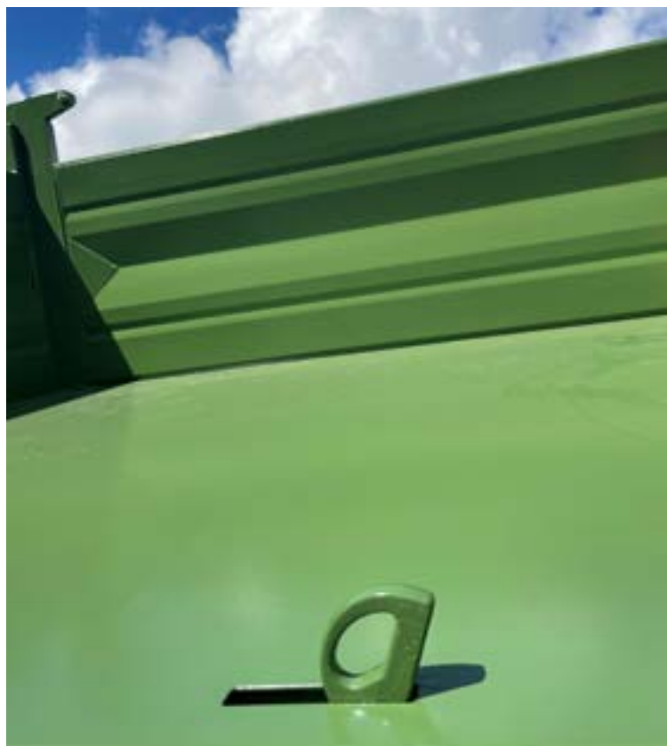
einschwenkbare Zurringe 4.000 daN Zurrkraft