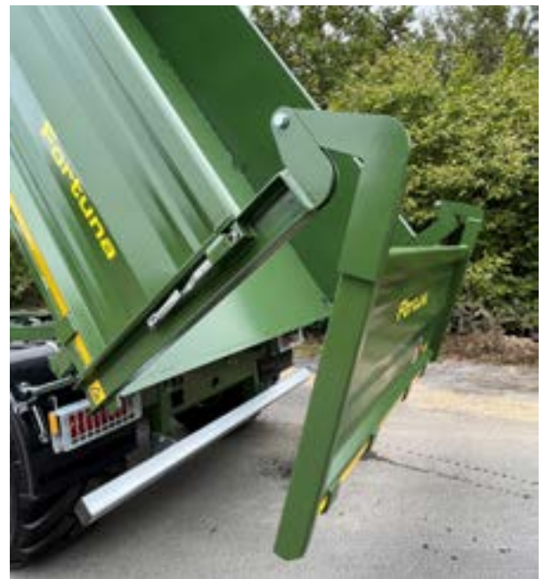
Heckklappe als pendelnde Heckklappe inkl. Drehpunkterhöhung (Verschluss über einen kleinen doppeltwirkenden Hydraulikzylinder)