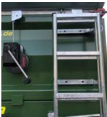
manuelle Sicherheits-Seilwinde mit automatischer Lastdruckbremse inkl. Umlenkrollen zum abklappen einer Bordwand