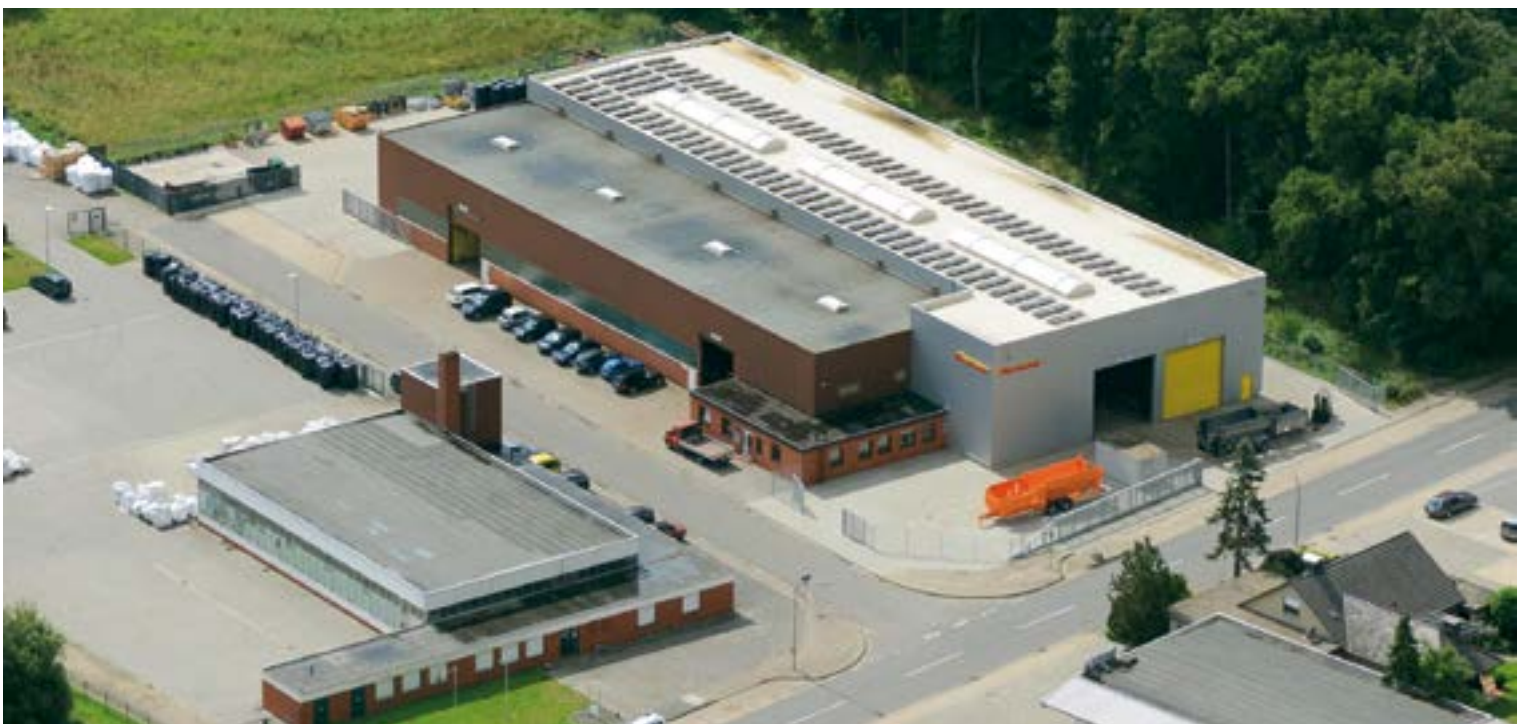
Produktionsstandort II 'Schützenstraße' – 48607 Ochtrup (Deutschland)