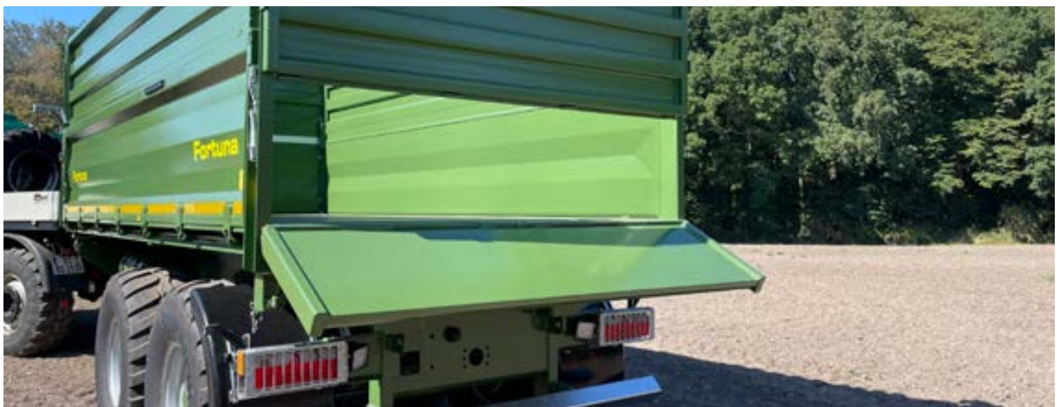
Heckklappe als Schotterklappe (circa 120 Grad nach unten öffnend), durch einen in der Kippbrücke liegenden, doppeltwirkenden Hydraulikzylinder inkl. Druckbegrenzungsventil