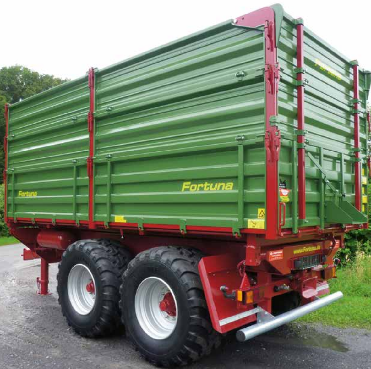
FTD 200/5.6 mit Mittelrungen und Heckklappe „System Fortuna“ (eingearbeitet)