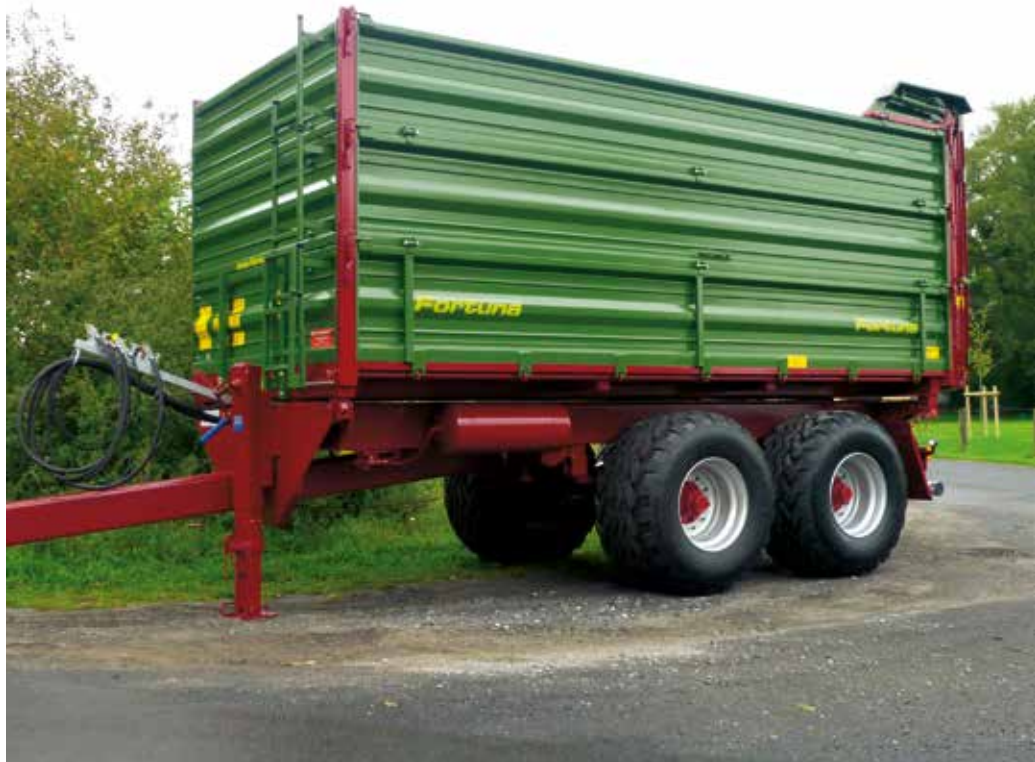
FTD 180/5.2 mit der Bereifung 620/50 R 22.5