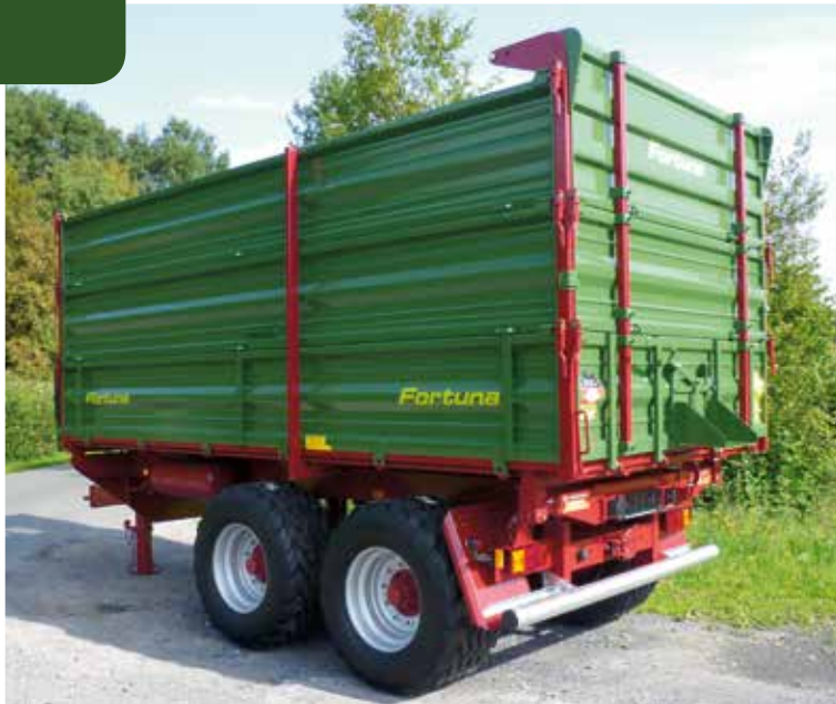
FTD 150/5.0 mit Heckklappe „System Fortuna“ (freistehend) und Silorungen