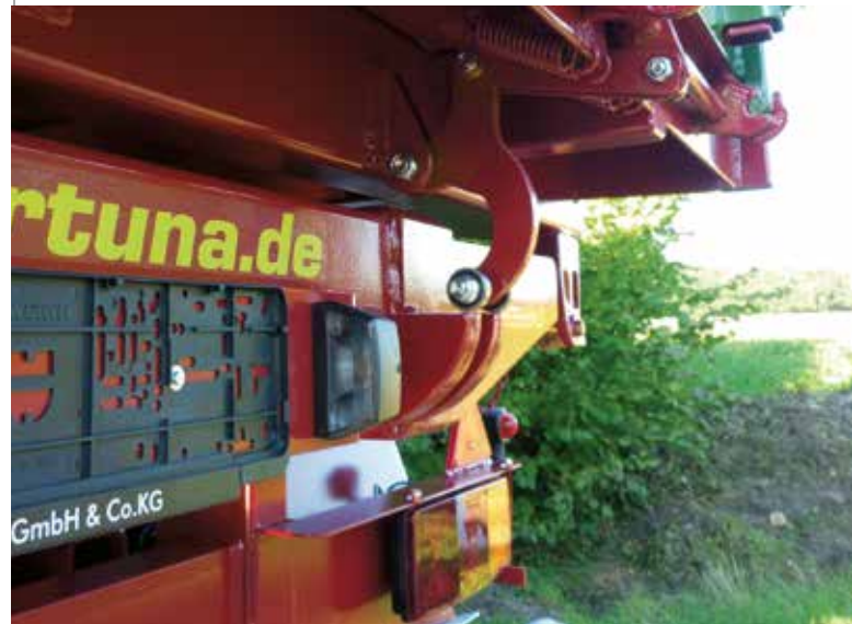
FTD 180/5.2 mit Heckklappe „System Fortuna“ (eingearbeitet)